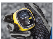
Fácil de manejar