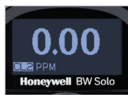
Fácil de leer