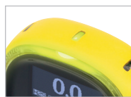
Fácil de ver