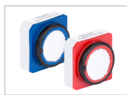
Fácil de mantener